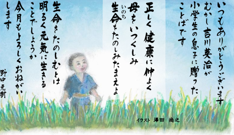
イラスト 澤田 尚之